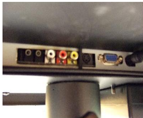
(背面) 視訊輸入接孔