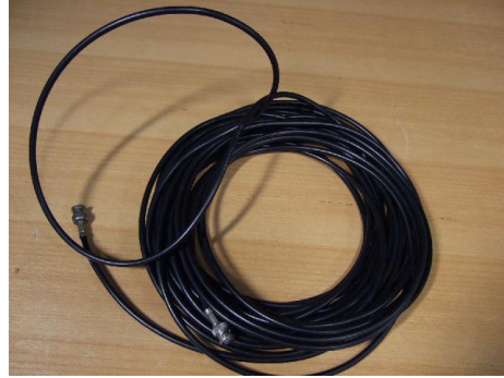
BNC 線( 附 BNC 母轉 RCA 公轉接頭)